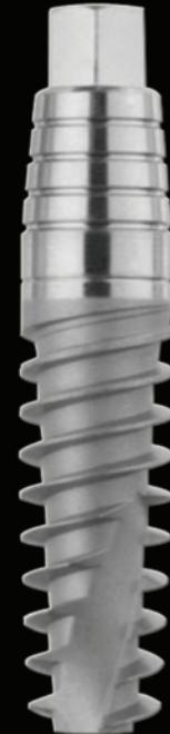
IMPIANTO INTEGRALE: carico immediato