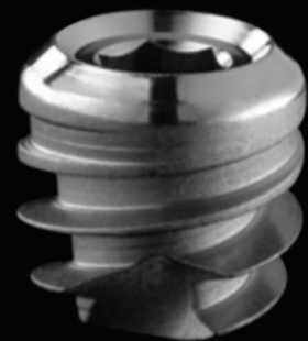
IMPIANTI CORTI (6-8 mm) diametro 4.5/5/6 mm